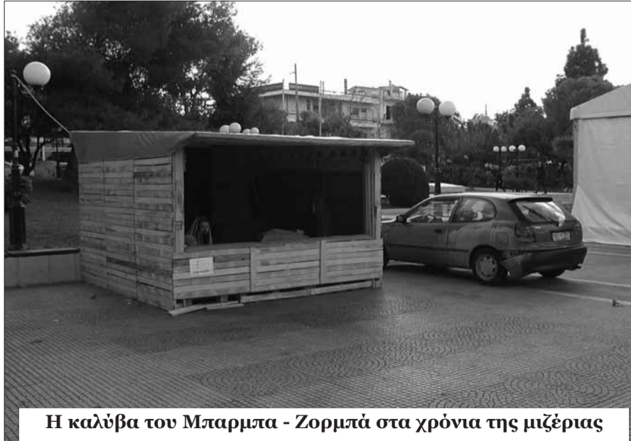
Η καλύβα του Μπαρμπα - Ζορμπά στα χρόνια της μιζέριας

Για ολιγοήμερες διακοπές στο Ναύπλιο βρέθηκε τα Χριστούγεννα ο πρωθυπουργός της χώρας Αντώνης Σαμαράς. Ο πρωθυπουργός έκανε τις βόλτες του στην παραλία της πόλης ενώ απόλαυσε τον καφέ του μαζί με φίλους του από την Αργολίδα. Μαζί του ήταν και ο συμπολίτης μας Γενικός Διευθυντής ΕΡΤ και τώως Νομάρχης κ. Δημήτριος Σαραβάκος.