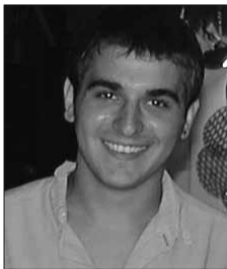
Επιμέλεια Χρήστος Μπαλαωτίης Εκδότης- Δημοσιογράφος