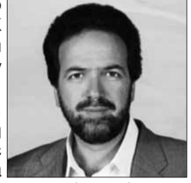
Ανδρέας Γκιζιώτης Επικεφαλής "Λαϊκής Συσπείρωσης"